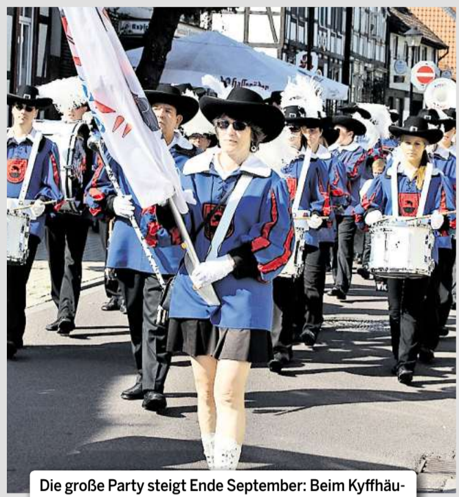
Die große Party steigt Ende September: Beim Kyffhäuserfest gibt's wieder einen großen Umzug, Programm im Festzelt und Aktionen für Kinder.

Volksfest: Fassanstich, Umzug und Live-Musik