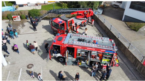
Tag der offenen Tür bei der Feuerwehr Vorsfelde

Etwa jeden dritten Tag rücken die Kameradinnen und Kameraden der Freiwilligen Feuerwehr Vorsfelde aus, um Wolfsburger Bürgerinnen und Bürger vor größerem Unheil zu bewahren. Für jeden Einzelnen und jede Einzelne ist es selbstverständlich, rund um die Uhr ehrenamtlich einsatzbereit zu sein. Neben den Einsätzen leistet die Feuerwehr Vorsfelde einen wertvollen Beitrag zum gesellschaftlichen Miteinander in Vorsfelde, z. B. werden das Aufhängen des Maikranzes, der Erntekrone und des Adventskranz unterstützt, weiter wird ein Feuerwehrfrühstück und eine Grünkohlwanderung organisiert und durchgeführt. Tag der offenen „Tore“ werden ebenso durchgeführt. Mit der Jugendfeuerwehr und der in 2019 gegründeten Kinderfeuerwehr engagiert sich die Feuerwehr für Jugendarbeit und Nachwuchsgewinnung.