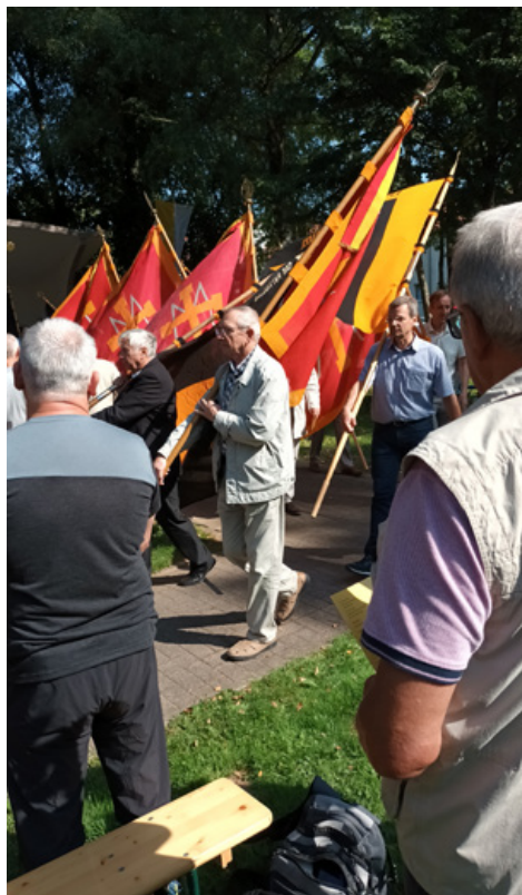
Teilnehmer der Diözesan-Wallfahrt in Germershausen

Sehr gut besucht waren der traditionelle „Himmelfahrtsausflug“ am 9. Mai zur St. Marien-Kirche Velpke sowie das sommerliche Grillfest Anfang Juli mit jeweils weit über 20 Teilnehmern.