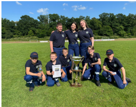
Jugendfeuerwehr Vorsfelde, Sieger beim Stadt-wettbewerb Wolfsburger Jugendfeuerwehren

Der Mitgliedsbeitrag beträgt nur 20 Euro pro Jahr und kann steuerlich geltend gemacht werden. Wer noch mehr über uns erfahren möchte, findet uns im Internet unter www.feuerwehr-vorsfelde.de sowie auf Facebook @FeuerwehrVorsfelde und Instagram @feuerwehr.vorsfelde.