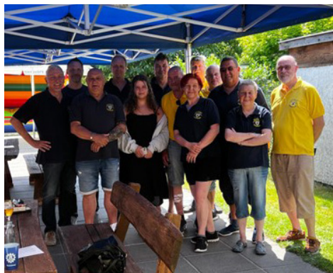
Das Helferteam, ohne das so eine Veranstaltung nicht möglich wäre.

Im September fand das Bundesschießen im Wolfsburger Schützenhaus statt. Die Kyffhäuser Vorsfelde hoffen, dass sie die sehr guten Ergebnisse vom Landesschießen dort wiederholt haben. (Ergebnisse sind noch nicht bekannt). Weitere Termine im Jahr 2024 sind im November Preisskat und Knobeln und im Dezember das Braunkohlessen mit Wanderung.